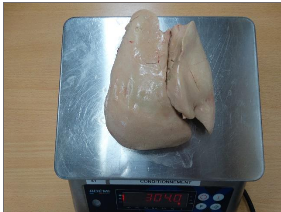
Foie de 304 grammes : foie gras selon la définition légale / dans la réalité foie un peu plus engraisé