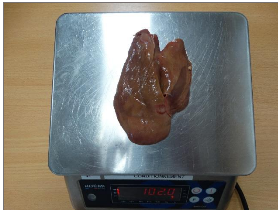
Foie de 102 grammes : foie maigre, encore rouge