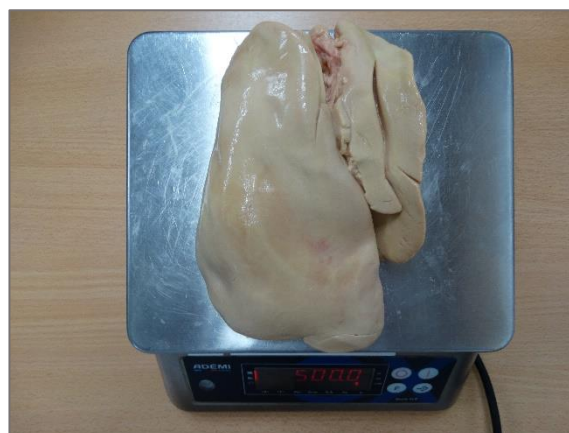
Foie de 500 grammes : foie gras : taille optimale, couleur claire, texture souple